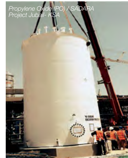
Propylene Oxide (PO) / SADARA Project Jubail- KSA