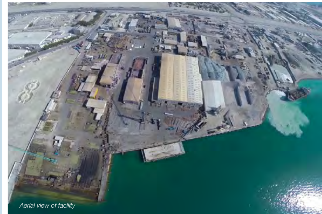
Aerial view of facility