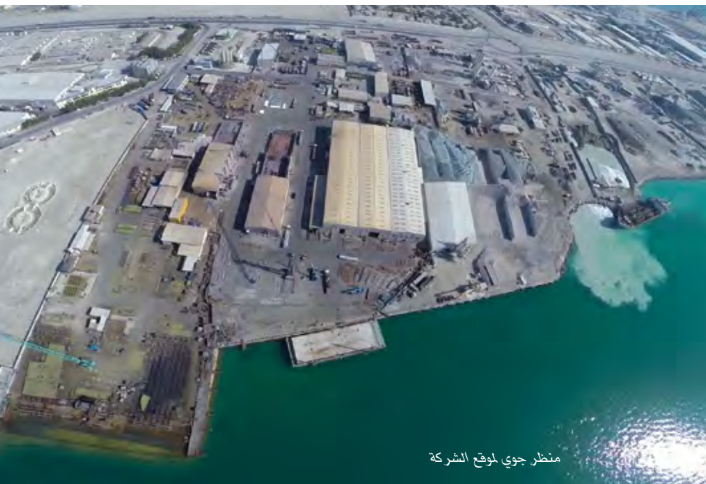
منظر جوي لموقع الشركة