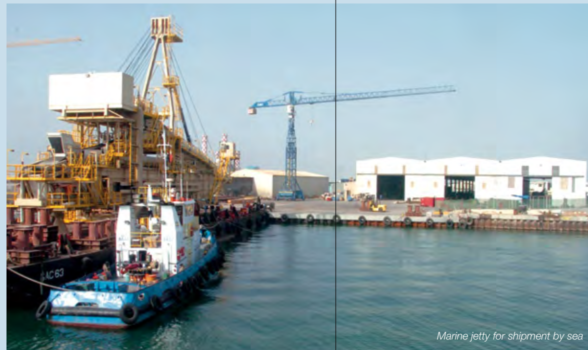
Marine jetty for shipment by sea