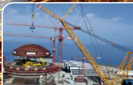
SARENS NASS DELIVERS THIRD GENERATION CRANE TO KSA

Leveraging Bahrain's fast-growing industrial sector