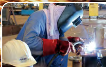
NMC: GLOBAL SHAPERS OF EPC WORLD