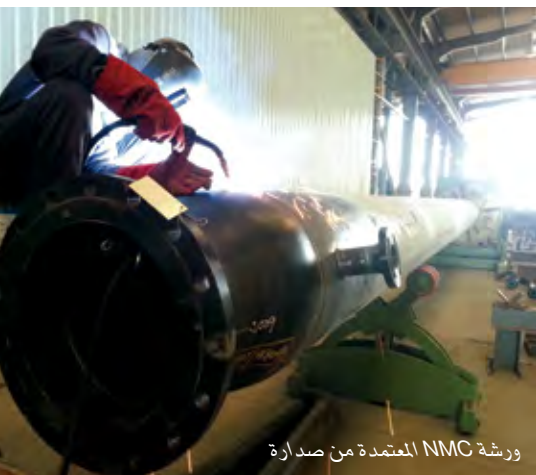
ورشة NMC المعتمدة من صدارة

مشروع صدارة لأكسيد البروبيلين (PO) في الجبيل في المملكة العربية السعودية.