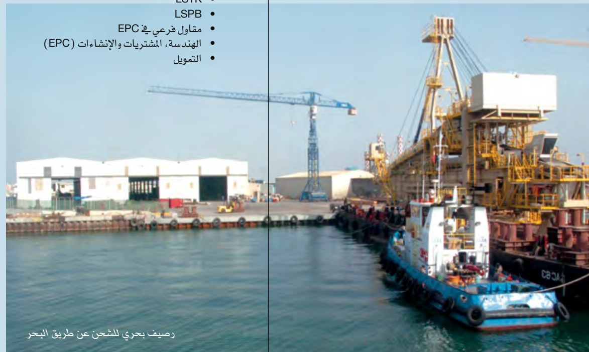
رصيف بحري للشحن عن طريق البحر