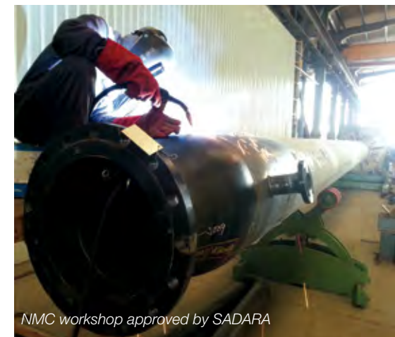
NMC workshop approved by SADARA