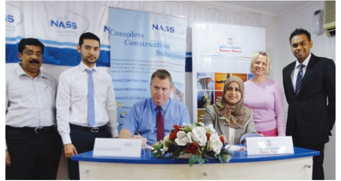
مؤسسة ناس توقع العقد مع سفريات كانو