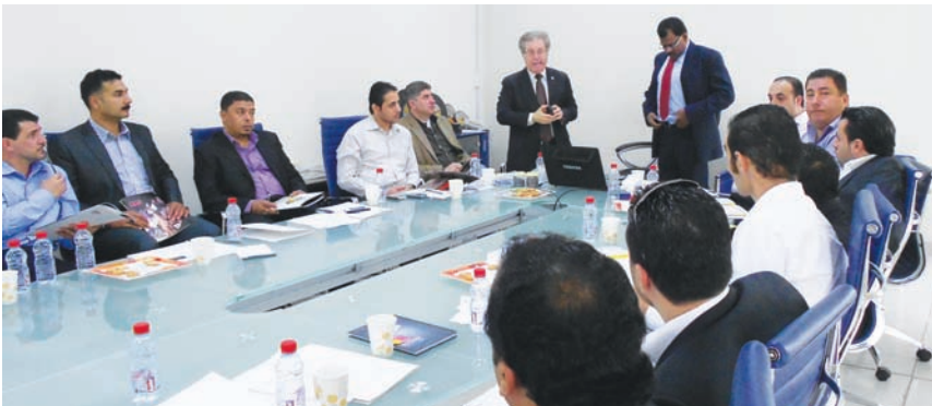
Attendees receive sales and product awareness training

Unitech Issam Kabbani & Partners for Building & Construction Co. Ltd. received a full day technical and sales training which was attended by 25 Unitech sales executives and managers from the Middle East.