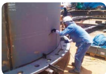
٩. مشروع العدد: مجزعة التيار الرئيسية والمداخن في دوروما، الرياض