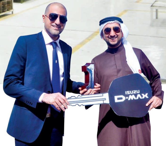
07 Isuzu Chooses Bahrain for Pick-Ups Launch