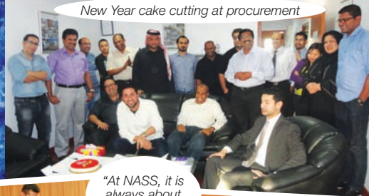
New Year cake cutting at procurement

"At NASS, it is always about team work!"