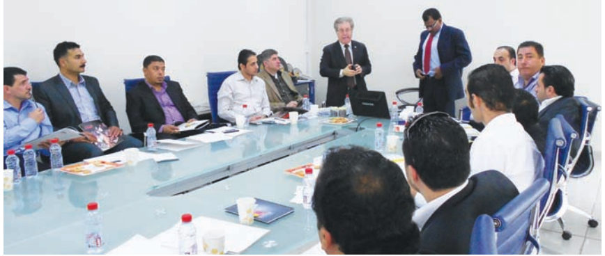
الحضور يتلقون تدريباً حول المبيعات والتوعية بالمنتج