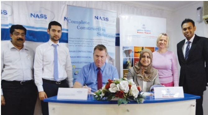
Deal signing by Nass Corp and Kanoo Travel