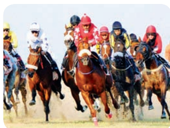
١١. ارباس يختطف كأس مجموعة ناس للخيول